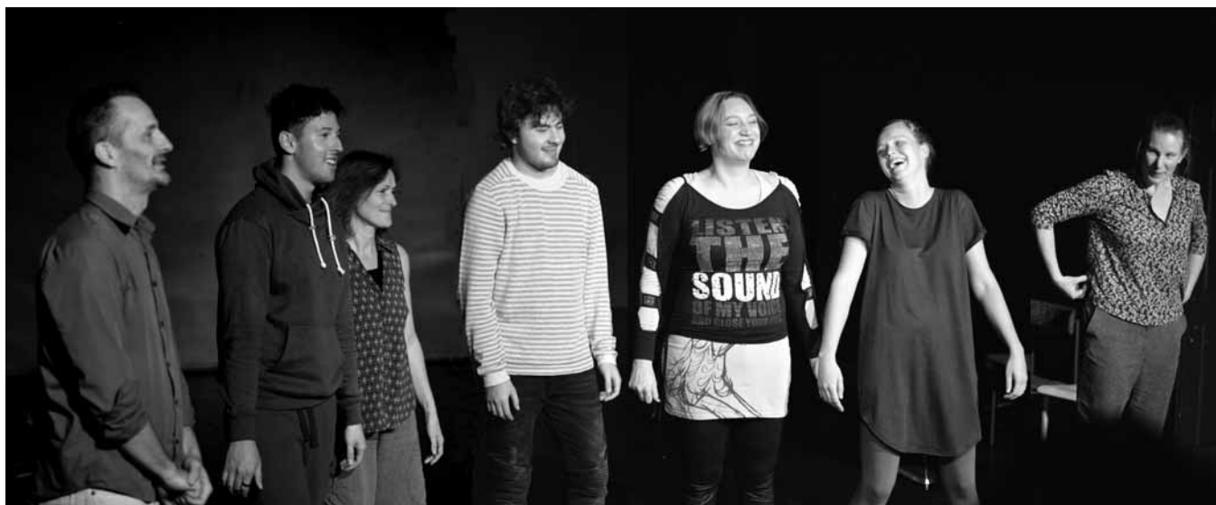
Igralke in igralci