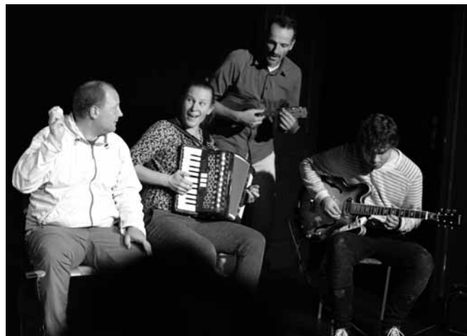
Glasbeni vložek s sodelovanjem publike